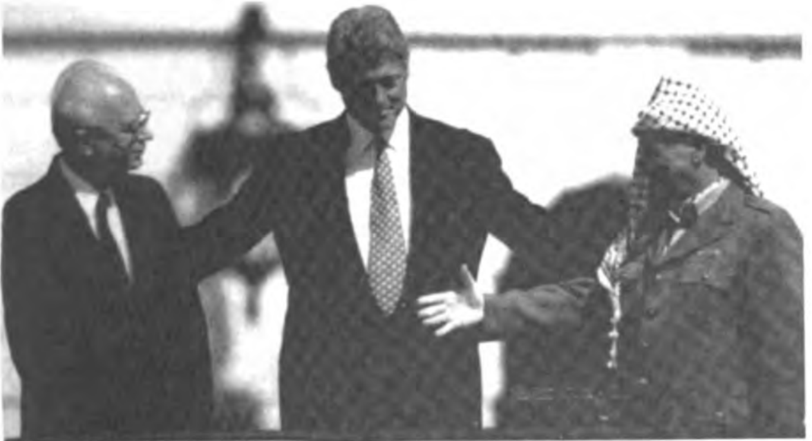
مع الرئيس الأميركي بيل كلينتون وإسحق رابين